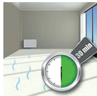
Zabezpieczenie wilgotnych podłóg z linoleum